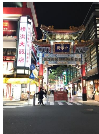
【みんなでおいしい物を！】