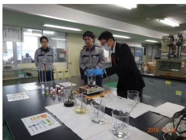
【日本オイルサービス様にてオイルの実験体験】