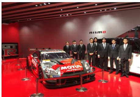
【憧れのモータースポーツの陣へ】

自動車整備・スポーツメカニクス科の3年生が参加する研修です。モータースポーツ好きの憧れの地に行きます。