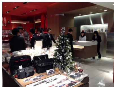
日産本社ギャラリー