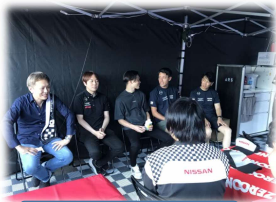
憧れのドライバーに直接質問