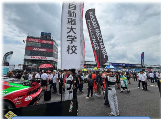
スタート直前グリッドウォーク