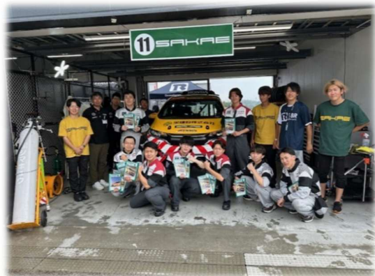
他チームピット訪問