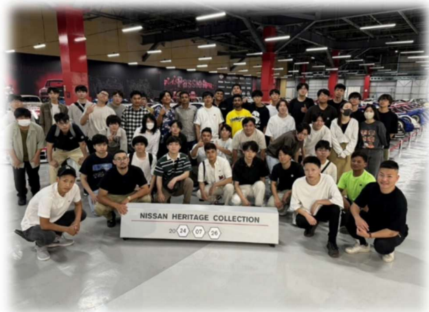
クラスの仲間と集合写真。親睦も深まります。