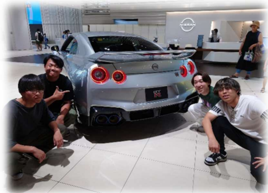
グローバル本社では新型車の見学と日産グッズのお買い物