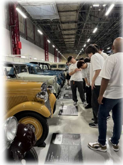
まず、ここにしかない車がたくさん