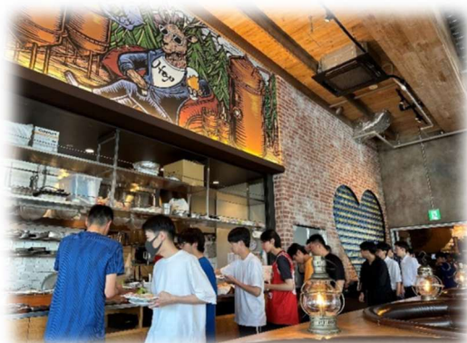
朝食はホテルのお洒落なレストランで