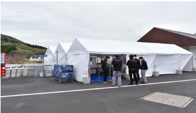
ホスピタリティ領域

ドライバーサポートとは、ドライバーがレースに集中できるように、身の回りのことをサポートする役割です。学生はそこで、自主性や、観察力を学ぶ事ができます。