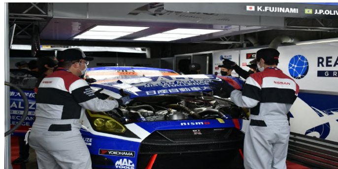
テクニカルマネージャー