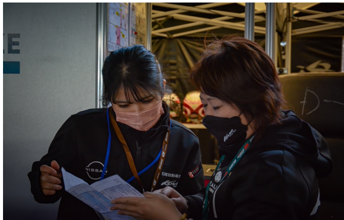
ドライバーサポート

NISSAN REALIZE YOKOHAMA PITWORK 日産車体 日産モータースポーツ&カスタマイズ ALTA ROCK PAINT PREMIER Assist 株式会社ゼロ SYRARS COAT TOPPAN NGK NTK MAP TOOLS Déff KAMMOTO LSI GEL GEL KSB SUNTORY 日産東京 日産プリンス栃木 日産プリンス埼玉 埼玉日産 神奈川日産 日産プリンス神奈川 岐阜日産 日産プリンス三重 愛知日産 日産プリンス名古屋 日産大阪 兵庫日産 愛媛日産 日産プリンス福岡 日産プリンス秋田 長野日産 松本日産 千葉日産 日産プリンス千葉 日産自動車販売 浜松日産 京都日産 日産サテリオ佐賀 日産プリンス長崎 青森日産 日産サテリオ弘前 岩手日産 日産プリンス岩手 日産プリンス宮城 栃木日産 新潟日産 甲斐日産 日産サテリオ千葉 日産サテリオ湘南 石川日産 福井日産 日産プリンス静岡 三重日産 和歌山日産 岡山日産 日産プリンス広島 日産プリンス山口 福岡日産 日産プリンス大分 宮崎日産 鹿児島日産