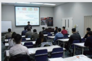
Hướng dẫn trước khi nhập học