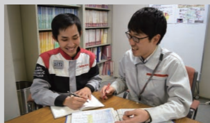
Hỗ trợ đến khi quyết định được việc làm!