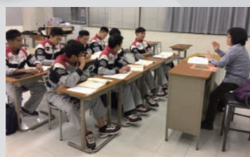
Lớp dạy tiếng Nhật