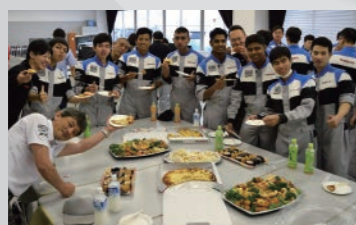
Buổi tiệc chào đón du học sinh