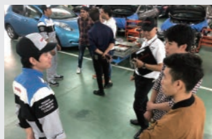
Thảo luận về vấn đề nào cũng được!

Thảo luận về bất cứ vấn đề gì bạn muốn hỏi, ví dụ như về kỳ thi đầu vào, khả năng học tập, thanh toán học phí, v.v! Ngoài ra, trước khi nhập học chúng tôi sẽ tổ chức buổi hướng dẫn (giải thích thắc mắc trước khi nhập học) chỉ dành cho những bạn đã đỗ nên các bạn có thể yên tâm nhập học!!