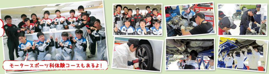
モータースポーツ科体験コースもあるよ!

日程 2/16(土)、3/9(土)、3/24(日) [4月以降も開催中] 横浜校では、楽しいオープンキャンパスを開催しています。スペシャルイベントやその他のいろいろ選べるコースがあり、体験実習もできるし、なんと無料ランチ付!! 満足していただけること間違いナッシング!! 整備士に興味のある方は、ぜひ参加してください。詳細は、横浜校HPまたは右下QRコードより。