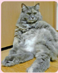
猫ちゃん情報：「社長 or メタボ」7さい♀ 私の車のエンジンルーム内でニャニャア鳴いていたので抱きました！

1 世界中の大抵のモノは美味しく食べられるのが特技です。(ゲテモノは除く)猫と一緒に昼寝。