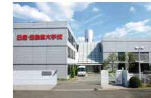
NISSAN AUTOMOBILE TECHNICAL COLLEGE KYOTO

Trường đa khoa đào tạo thợ bảo dưỡng chuyên nghiệp, tự hào với thiết bị thực hành quy mô lớn nhất Nhật Bản