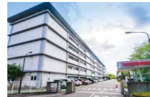
NISSAN AUTOMOBILE TECHNICAL COLLEGE YOKOHAMA

Trường trực thuộc hãng NISSAN, nơi học viên có thể học các kỹ thuật hiện đại nhất của "Nissan - Hãng coi trọng kỹ thuật"