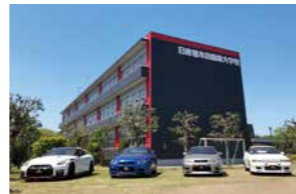
NISSAN AUTOMOBILE TECHNICAL COLLEGE TOCHIGI

giúp bạn có thể lựa chọn phù hợp với ước mơ của riêng mình!