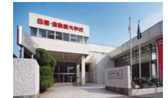
NISSAN AUTOMOBILE TECHNICAL COLLEGE EHIME

Học viên có thể học về ô tô trong môi trường thực hành và thiết bị hiện đại nhất