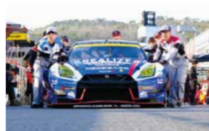
Tham gia cuộc đua

Sinh viên sẽ học được "Tâm quan trọng của thử thách, tinh thần đồng đội và lòng hiếu khách" thông qua việc tham gia vào các cuộc đua với tinh thần quyết thắng. Ngoài ra, trong "Dr. K Project" là chương trình kiểm tra ô tô miễn phí của sinh viên, sinh viên sẽ tiến hành kiểm tra miễn phí ô tô sử dụng trong môi trường đảo khắc nghiệt, để bị hư hại do muối và đường dốc. Góp phần đảm bảo an toàn cho xã hội ô tô.