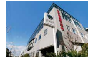
NISSAN AUTOMOBILE TECHNICAL COLLEGE AICHI

Trường đa khoa đào tạo kỹ sư ô tô với đầy đủ các khóa học đa dạng